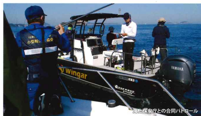
海上保安庁との合同パトロール