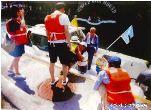
イベントでの体験航海

九州で開催されるボートショーなどのイベントにおいても、ブースを設け、協会の活動等を幅広く知ってもらうとともに、海上交通安全思想の普及に努めています。なお、各種イベントにおいては、海上交通安全思想の啓発・普及活動の一環として、安全啓発の標語や事故防止の呼びかけが記載されたうちわ等のグッズを作成・配布し、海上安全意識の向上を図っています。