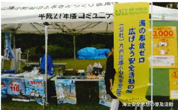
海上安全思想の普及活動