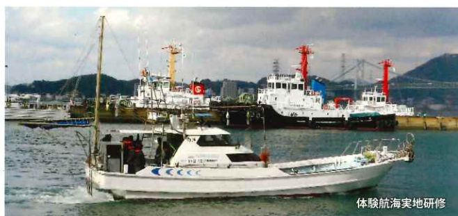
体験航海実地研修