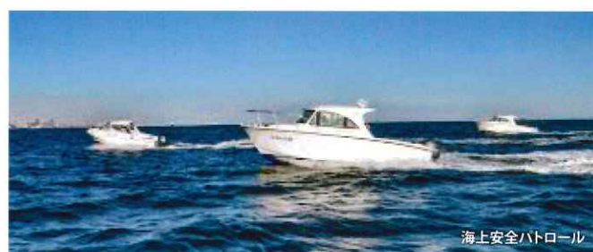
海上安全パトロール